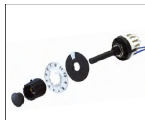
Commutatore per selezione 12 gruppi da 5 setpoint. Selector switch for 12 groups of 5 setpoint.