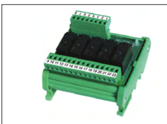
Modulo 5-relé esterno per aumentare la portata dei contatti di scambio a 2A/115Vac. External 5-relay module to increase the capacity of SPDT contacts to 2A/115Vac.